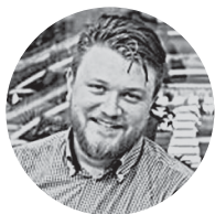
Николай Рихтер Лепим и Варим