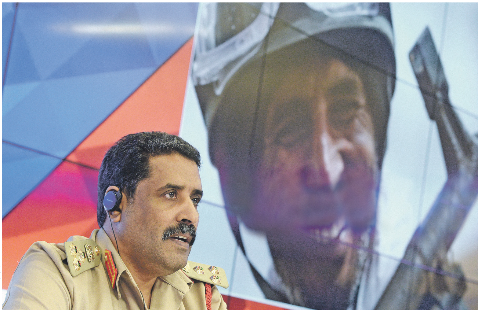
Пресс-секретарь Ливийской национальной армии бригадный генерал Ахмад Аль-Мисмари с надеждой смотрит в будущее примирения, уверенный, что московская площадка в урегулировании конфликта будет эффективнее предыдущих

Ливийский вице-премьер встретился в Москве 15 сентября