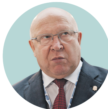
Валерий Шанцев, губернатор Нижегородской области