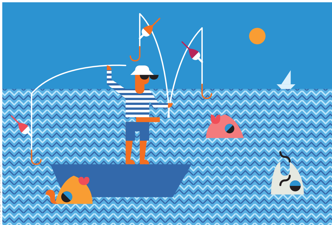
Иллюстрация: bogusfreak для РБК

Из 50 крупнейших российских банков у 15 игроков есть сезонные вклады в рублях с повышенной ставкой. Самую высокую фиксированную ставку предлагает Бинбанк — в нем вклад «Летний» можно открыть под 8,5% годовых. На втором месте по доходности депозит «Сезонный» в Почта Банке — ставка по этому вкладу составляет 8,25% годовых. Это несколько больше, чем доходность регулярных депозитов в рублях в топ-15 банков по объему привлеченных средств: в июне максимальная ставка по вкладу на год составляла 8% годовых, на три года — 7,4% годовых.