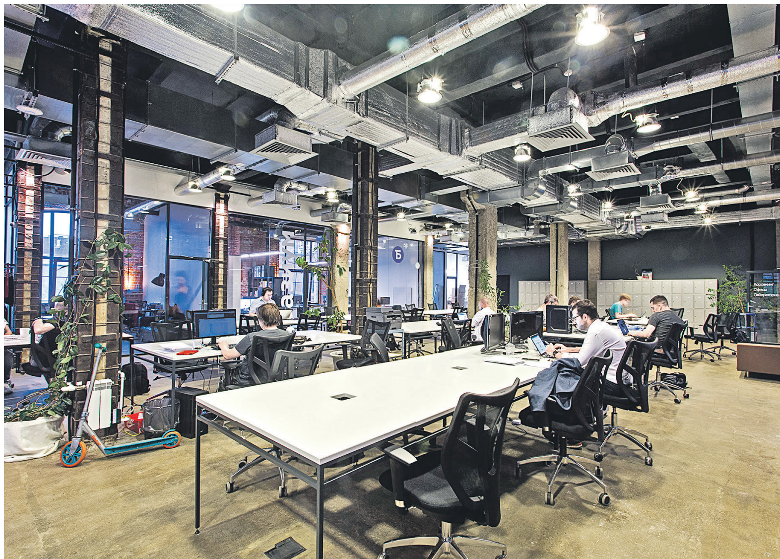
Всего на данный момент «Ключ» открыл шесть коворкинговых площадок в центре Москвы общей площадью почти 7000 кв. м

Сперва бизнес-интересы не были главными: предприниматели не скрывают, что за счет открытия нового места в Москве в первую очередь хотели решить вопрос с офисом своей компании. «Мы посидели в других коворкингах и нигде не нашли дружелюбной