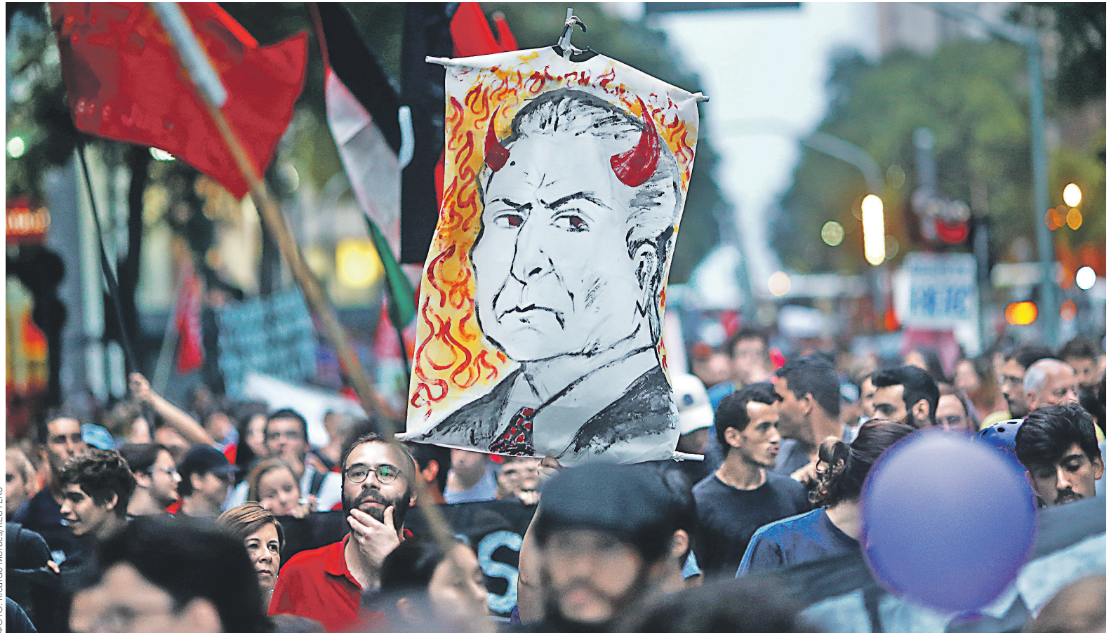
По подсчетам генпрокурора Бразилии, всего за девять месяцев президентства Мишел Темер получил взятку на сумму около $12 млн

По утверждению прокуратуры, эти деньги представляли собой взятку и это лишь часть коррупционной схемы, в рамках которой президент, используя служебное положение, решал в пользу JBS налоговые вопросы, помогал добиться сниженных цен на эне-