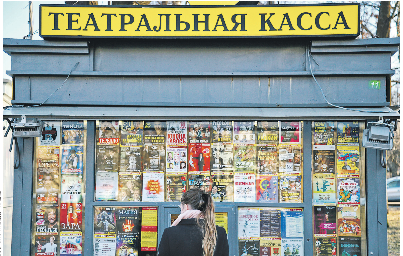
На спектакли в Большом спекулянты скупают 15% всех билетов, в «Ленком» и МХТ им. Чехова — 20%, в Театре наций и Театре им. Вахтангова — по 10–15%, утверждает один из столичных перекупщиков

За свои услуги Ticketland получает 10–12% от суммы проданных билетов и берет еще 10% сервисного сбора с покупателей. Генди-