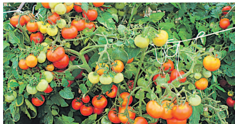
Непас 14 (Непасынкующийся сахарный). Обилие сладких, сахарных плодов

Каждый огородник мечтает о сортах и гибридах, не требовательных к условиям выращивания, не нуждающихся в дополнительном формировании растения и дающих ранний и обильный урожай. Не все сорта томатов на это способны, поэтому к выбору сорта нужно подходить тщательно. Представляем вам томаты серии «НЕПАС», которые не доставят вам много хлопот и принесут прекрасный урожай!