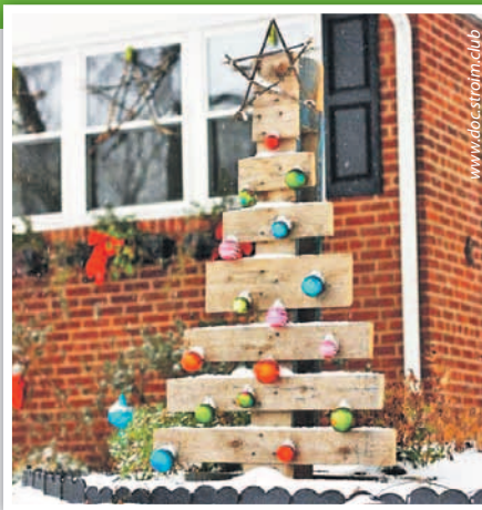
Елка из досок

Еще одна простая, но от этого не менее эффектная идея для самодельной елки. «Нарисуйте» гирляндой на стене контур новогоднего дерева и зафиксируйте ее. Все, праздничный антураж готов!