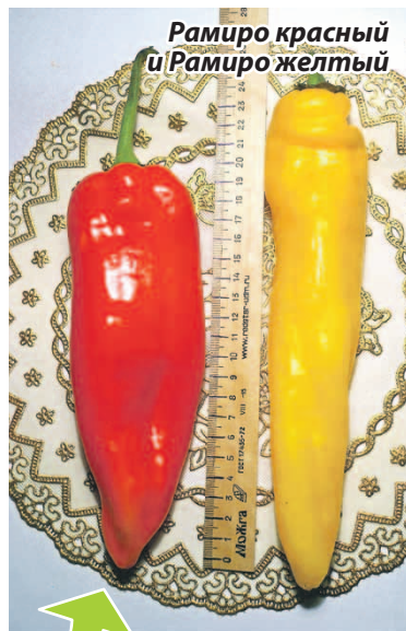
Рамиро красный и Рамиро желтый

В выращивании Рамиро не напрягает, неприхотливый, на кусте перцев вяжет много. Надо подвязывать, чтобы ветки не сломались. Кроме еды, в свежем виде мы делаем из него очень сладкое и густое лечо, а также сушим на солнце, несколько дней даже на солнцепеке – и он готов. Зимой кладем в борщ или рагу – вкуснятина.