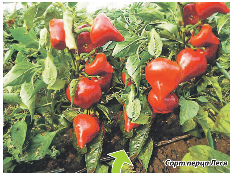
Сорт перца Леся