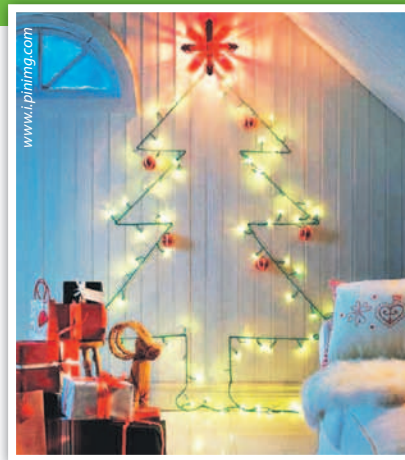
Елка из гирлянды