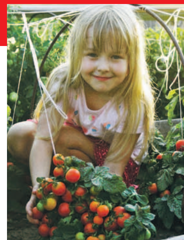
Непас 11 (Непасынкующийся комнатный)

Для заготовок подойдет плотные плоды с высоким содержанием сухого вещества следующих сортов: Непас 4 (Оранжевый сердцевидный) . Имеет очень декоративную форму плодов, они очень плотные), Непас 6 (Красный с носиком), Непас 5 (Оранжевый с носиком), Непас 8 (Морковный) . Имеет удлиненную форму, отсюда и название), Непас 9 (Удлиненный), Непас 10 (Полосатый) . Имеет очень декоративные круглые красные плоды в желтую полоску), Непас 13 (Сливовидный) .