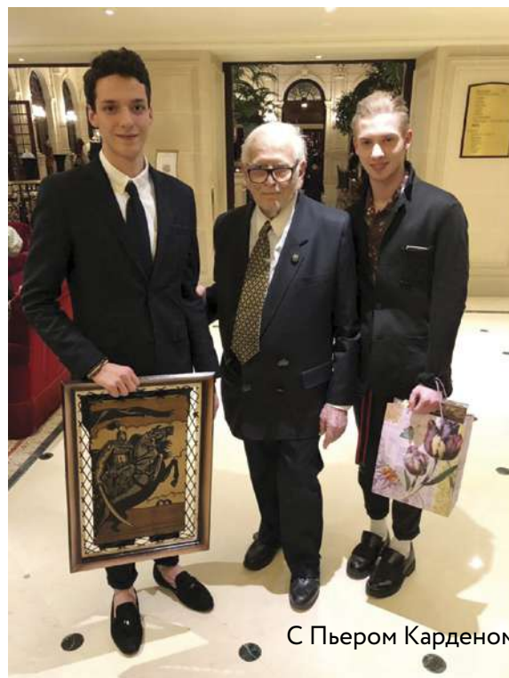
С Пьером Карденом

Сейчас я учусь, накапливаю знания и опыт, обрастаю связями, и в ближайшие годы планирую поработать где-нибудь в Европе. Где именно, пока не знаю. Но мир сегодня открыт, люди легко перемещаются между странами, и я уверен, что найду свое место.