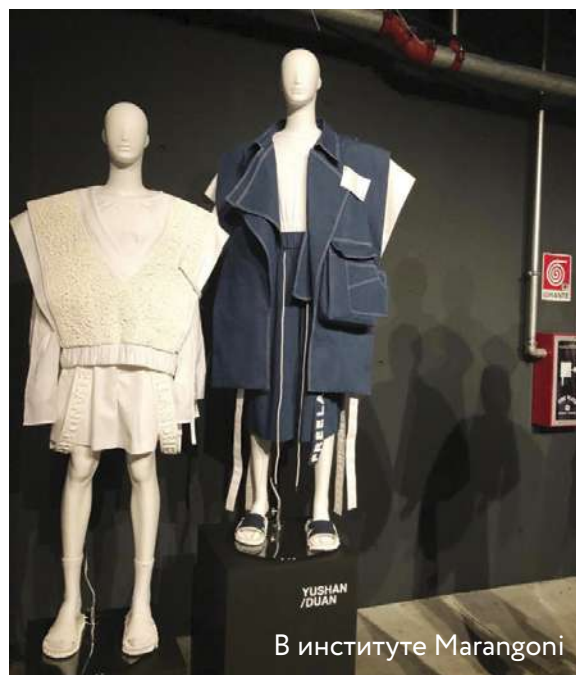
В институте Marangoni